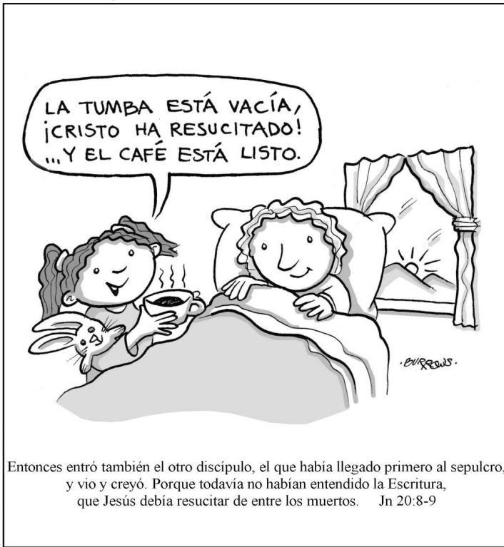
Entonces entró también el otro discípulo, el que había llegado primero al sepulcro, y vio y creyó. Porque todavía no habían entendido la Escritura, que Jesús debía resucitar de entre los muertos. Jn 20:8-9

Scripture from La Biblia de los Americanos © 1986, 1995, 1997, The Lockman Foundation. Used by permission.