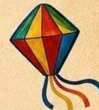
DIVERSÃO PARA TODA A FAMÍLIA